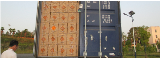
Figure 2: A large shipping container filled with boxes, secured with orange straps.

The boxes are also labeled with the following information: (1) Product name and description, (2) Lot number and expiration date, (3) Manufacturer information, (4) Shipping and handling instructions, (5) Contact information for the manufacturer or distributor, (6) Safety information (MSDS).