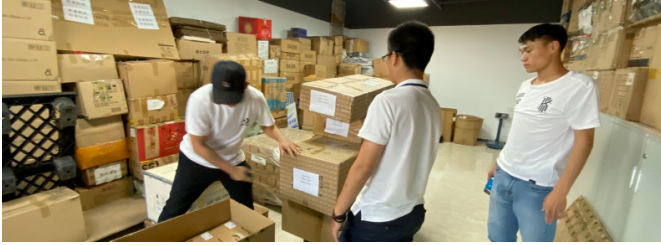
Figure 1: Warehouse workers handling boxes in a storage area.

The warehouse workers are handling boxes in a storage area. The boxes are stacked on pallets and are labeled with various information. The workers are wearing white shirts and dark pants. The warehouse is well-lit and has a clean, organized appearance.