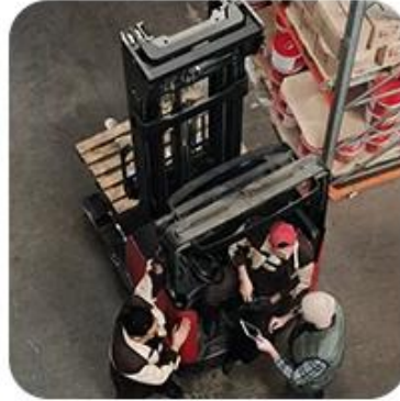
2) Pick-Up Cargo from 1 or Mutli Factory