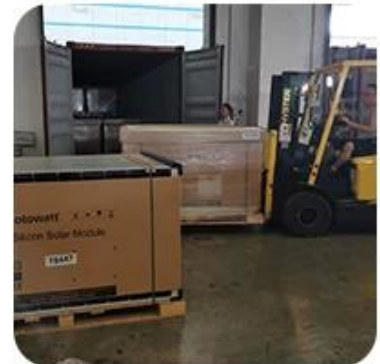
6) Loading to Container