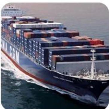
7) Shipping to Destination