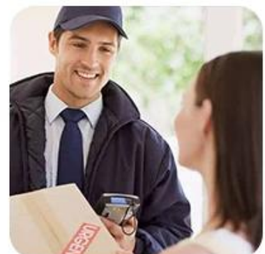
9) Delivery to Door