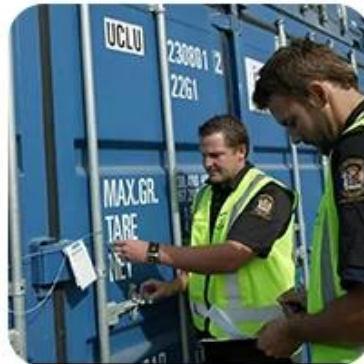
5) Export Customs Clearance