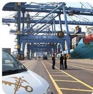
8) Import Customs Clearance