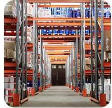
3) Delivery to Warehouse