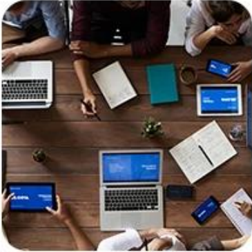
1) Offer Shipping Schedule