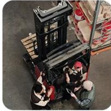
2) Pick-Up Cargo from 1 or Mutli Factory