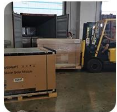
6) Loading to Container