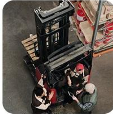
2) Pick-Up Cargo from 1 or Mutli Factory