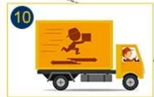
Deliver to door