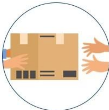
11. Arrive destination