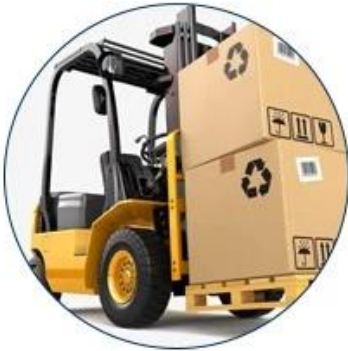
7. Unpacking container