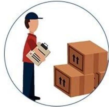
9. Ready for collection