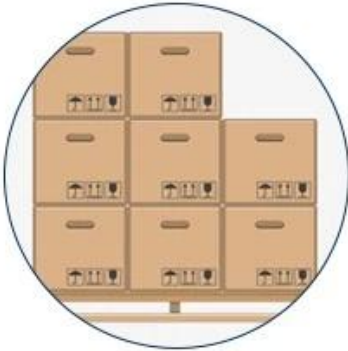
4. Palletising and labeling