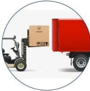
5. Pack into container