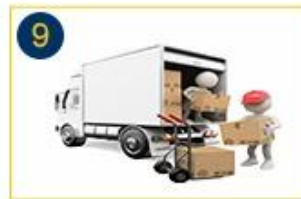
Prepare to Deliver