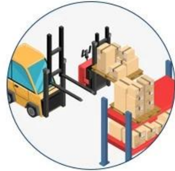
3. Deliver to warehouse