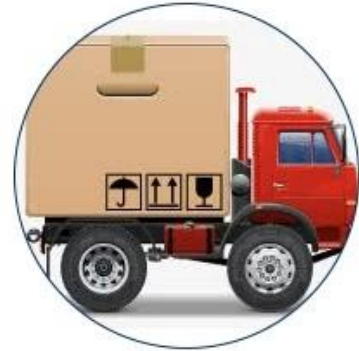
6. Start shipping