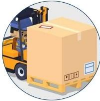
2. Pick up from origin