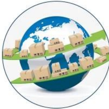
8. Import clearance