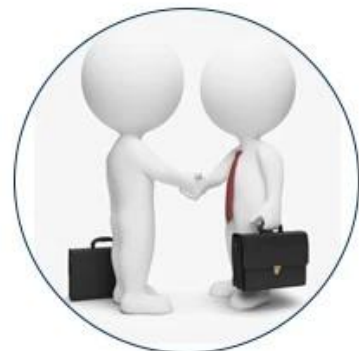
12. Follow up