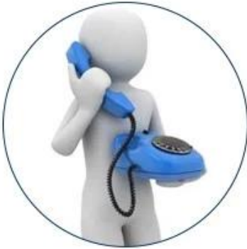
1. Discuss shipment