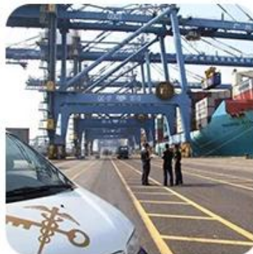
8) Import Customs Clearance