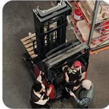
2) Pick-Up Cargo from 1 or Mutli Factory