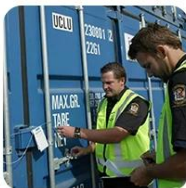
5) Export Customs Clearance