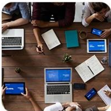
1) Offer Shipping Schedule