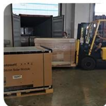
6) Loading to Container