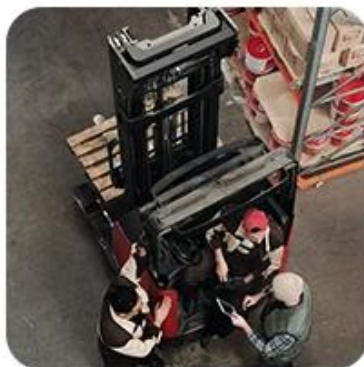
2) Pick-Up Cargo from 1 or Mutli Factory