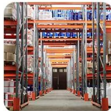
3) Delivery to Warehouse