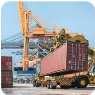
4) Loading on Boat