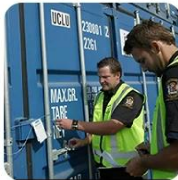
5) Export Customs Clearance