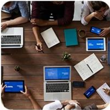
1) Offer Shipping Schedule