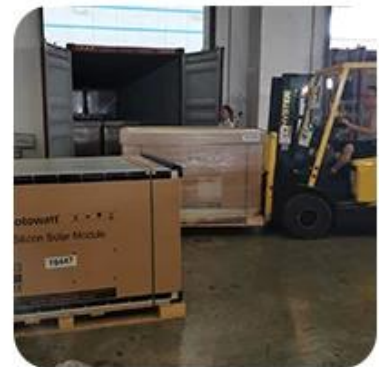
6) Loading to Container