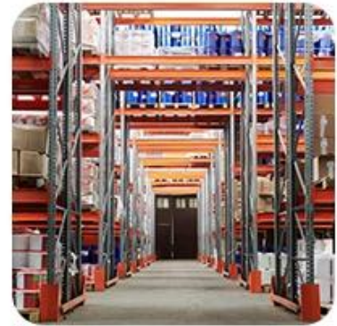
3) Delivery to Warehouse