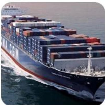
7) Shipping to Destination