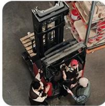
2) Pick-Up Cargo from 1 or Mutli Factory