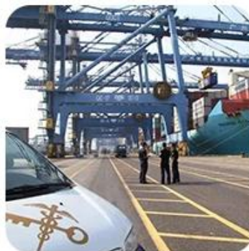
8) Import Customs Clearance