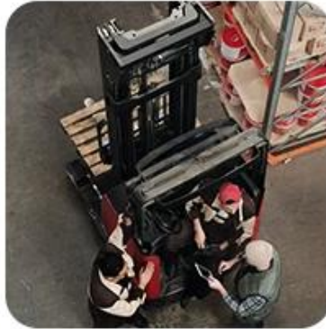
2) Pick-Up Cargo from 1 or Mutli Factory