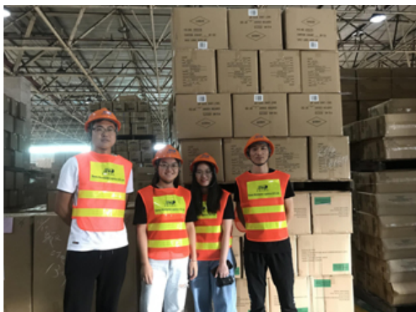
Фото груза Бен, Бен.

Полезные советы: указанное выше время доставки только для вашей информации.